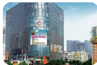
中纺四季青国际服装城