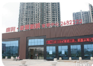
九州天虹广场(一期) 建设工程