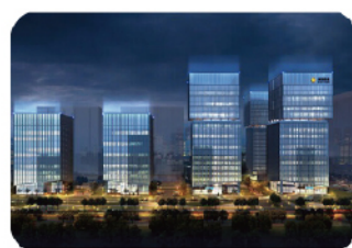
鼎泰和国际金融中心