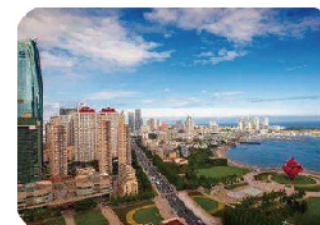
国家(青岛)通信产业园