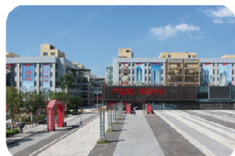
重庆朝天门国际商贸城