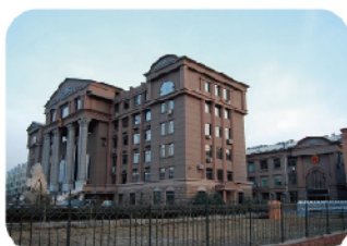
济南市市中区人民法院 诉讼服务中心